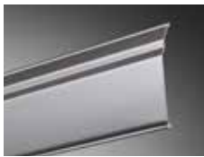
Comfort & Design Lamelle CDL 70