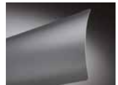
Flachlamelle FL 80, FL 60