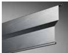
Z-Lamelle ZL 81