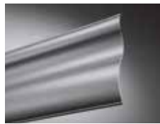
Dreibogenlamelle DBL 85, DBL 70